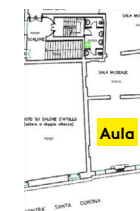
Affollamento massimo consentito Aula piano secondo, 25 persone