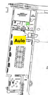
Affollamento massimo consentito Aula piano terra, 35 persone